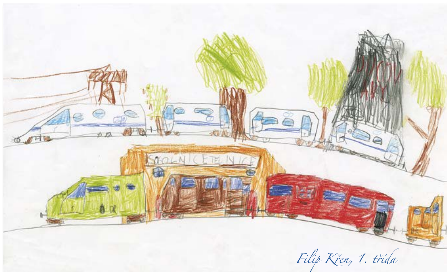
Filip Křen, 1. třída