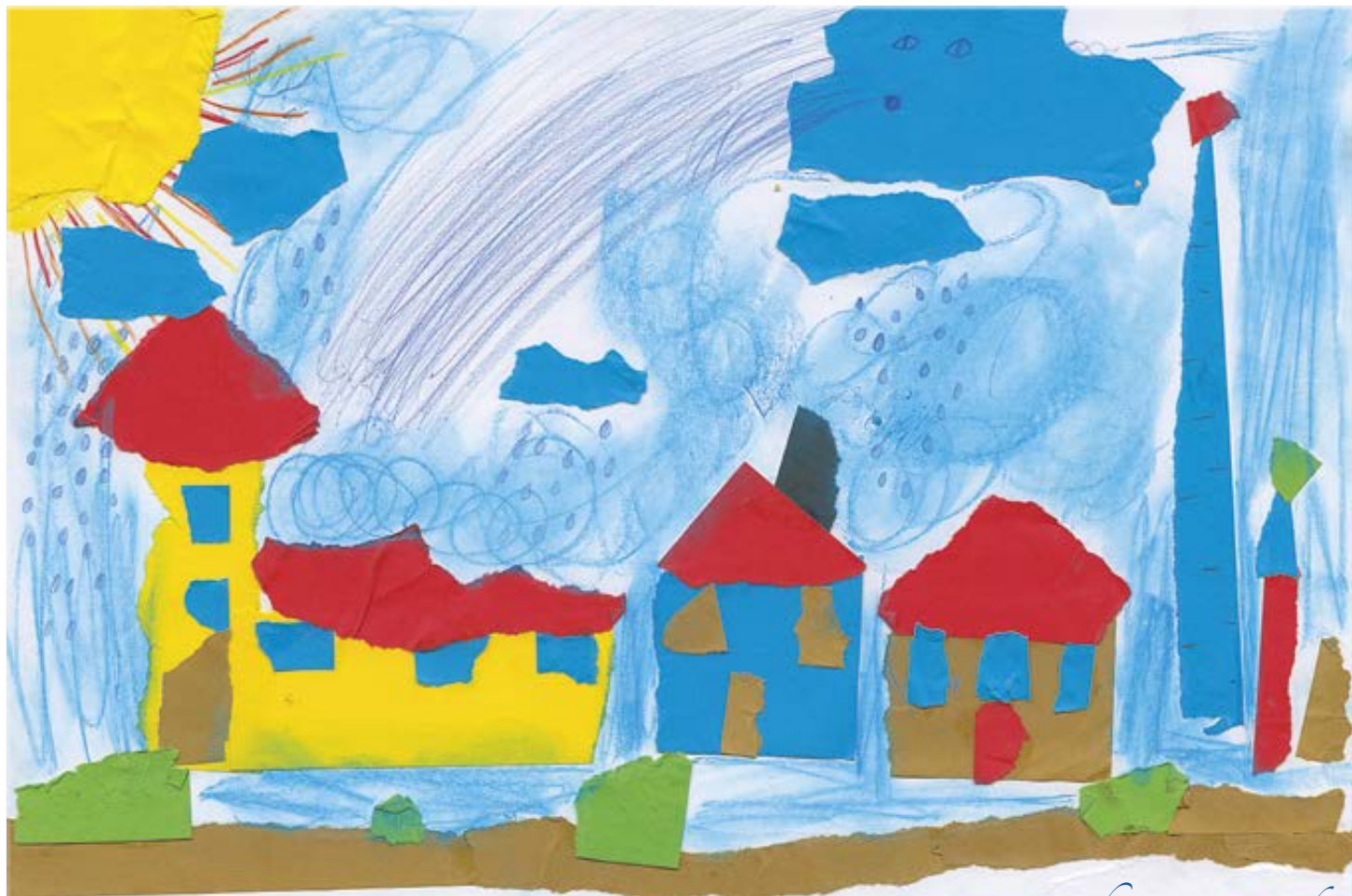
Kateřina Fischerová, 3. třída