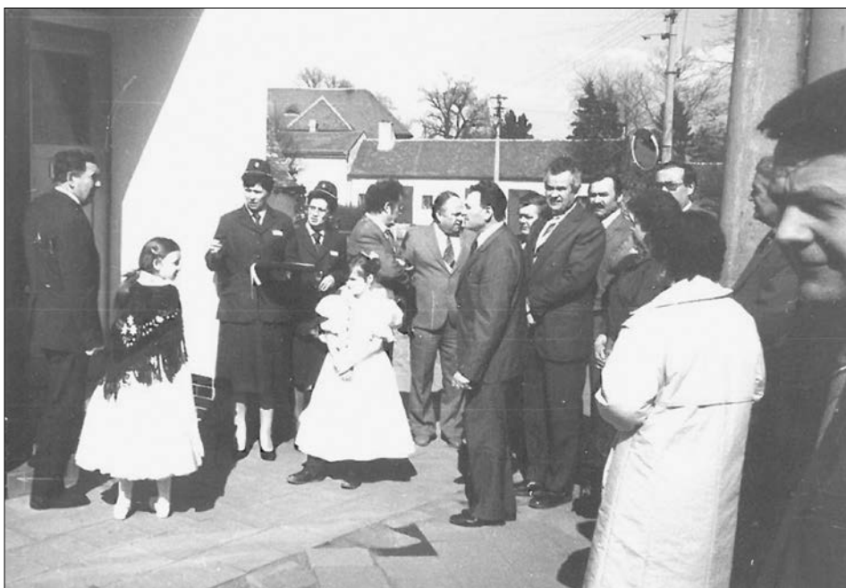
Otevírání telnické poštovní pobočky