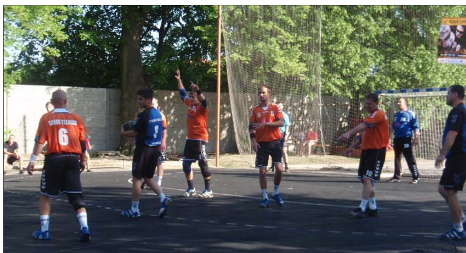
Z utkání mužů Sokolnice–Telnice

Na házenkářskou sezonu 2011/2012, která se z podstatné části odehrála v nově vybudované sportovní hale v Telnici, se začali už v srpnu připravovat čtyři mládežnická družstva a tým mužů.