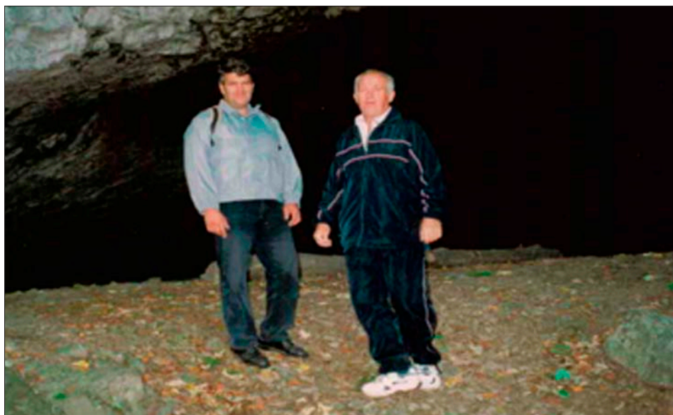
Autoři článku u jeskyně Pekárna

Žijeme na březích Zlatého potoka (dnes Říčky). Kdo z nás ale ví, kde pramení? Kdo jsme tam byli? Co známe o jeho historii a krajině, kterou protéká a ve které žijeme? Většina si vzpomene na události bitvy tří císařů, když se v posledních létech začíná vzpomínat na hlavní boje mezi Telnicí a Sokolnicemi právě na březích Zlatého potoka. Jde o území, které se geologicky vytvořilo před 2–3 miliony let, ve čtvrtohorách. Dá se tedy říci, že nám známý ráz krajiny (až na lesy, které člověk vykácel) tu existuje již dlouho. Voda historického Zlatého potoka, který tvoří soutok Říčky a Rokytnice nad Kobylicemi, plyne krajinou tisíce let. Protéká Moravským krasem, kolem z jeskyně Pekárna, která nese znám-