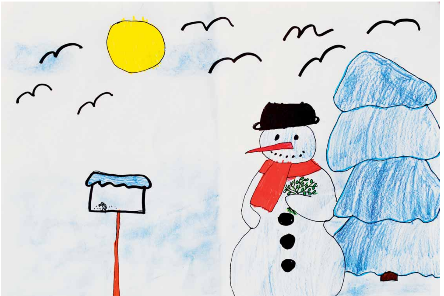
Verča Zemanová, 3. třída