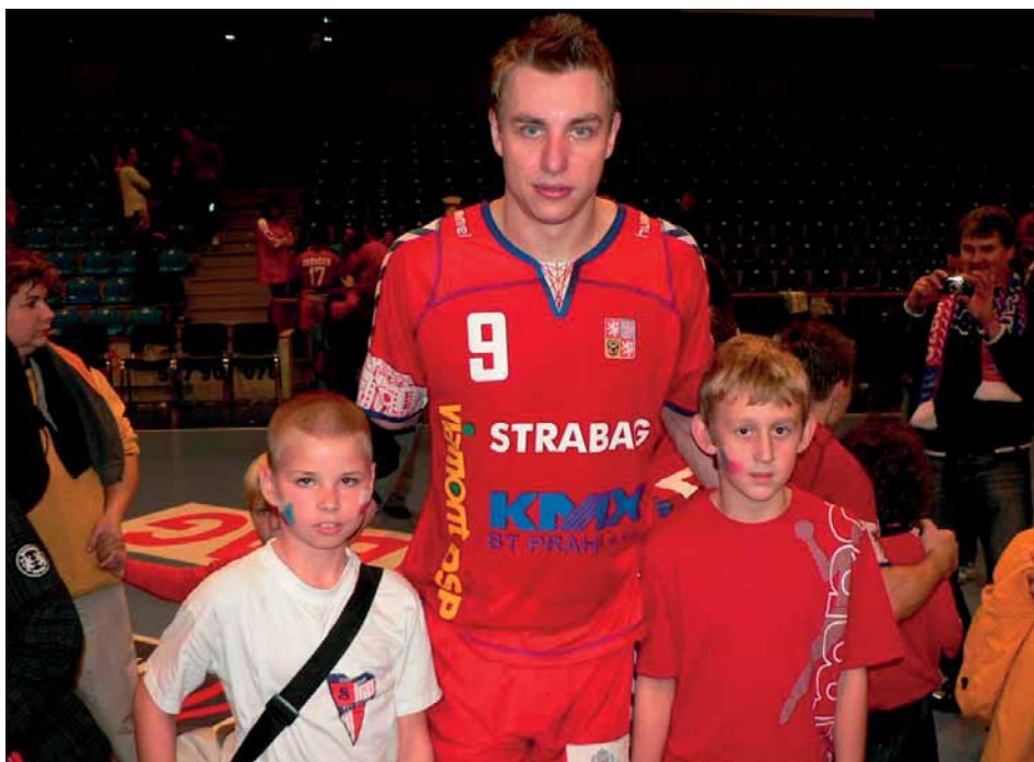
Ve Zlíně při kvalifikačním utkání české reprezentace s Řeckem fandili i Telničáci. Na fotce po zápase je vidíte s nejlepším házenkářem světa Filipem Jíchou.

Minižáci Telnice – to je v současné době více než 30 dětí od 5 do 10 let, které baví házená. Na hřišti a v sále sokolovny se scházejí třikrát týdně a učí se první písmena házenkářské abecedy. Co se naučily, ověřují na turnajích v blízkém i dalekém okolí. Během podzimu se ti největší z nejmenších úspěšně infiltrovali do týmu mladších žáků a zatížili konta soupeře řadou branek. V závěru podzimu se minižáci zúčastnili společně s Velkou Bystřicí, Olomoucí a Újezdem u Brna herního soustředění