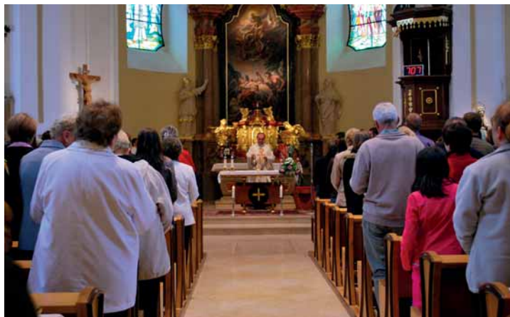
Bohoslužba v kostele

(viz článek na straně 12, foto Veronika Klesalová)