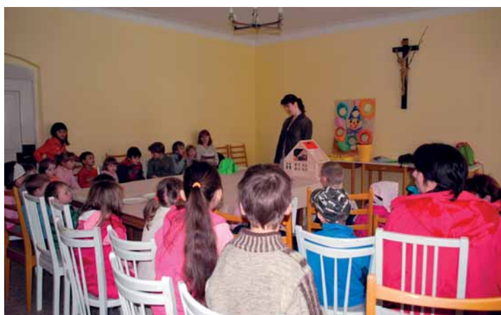
Pohádka pro děti