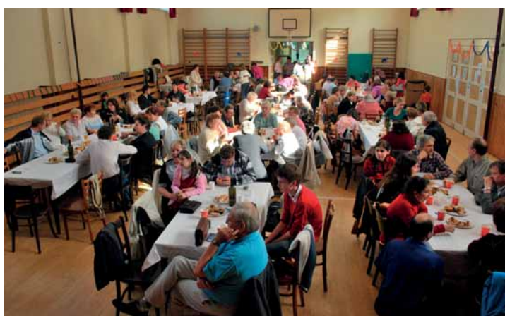
Farní den na sokolovně