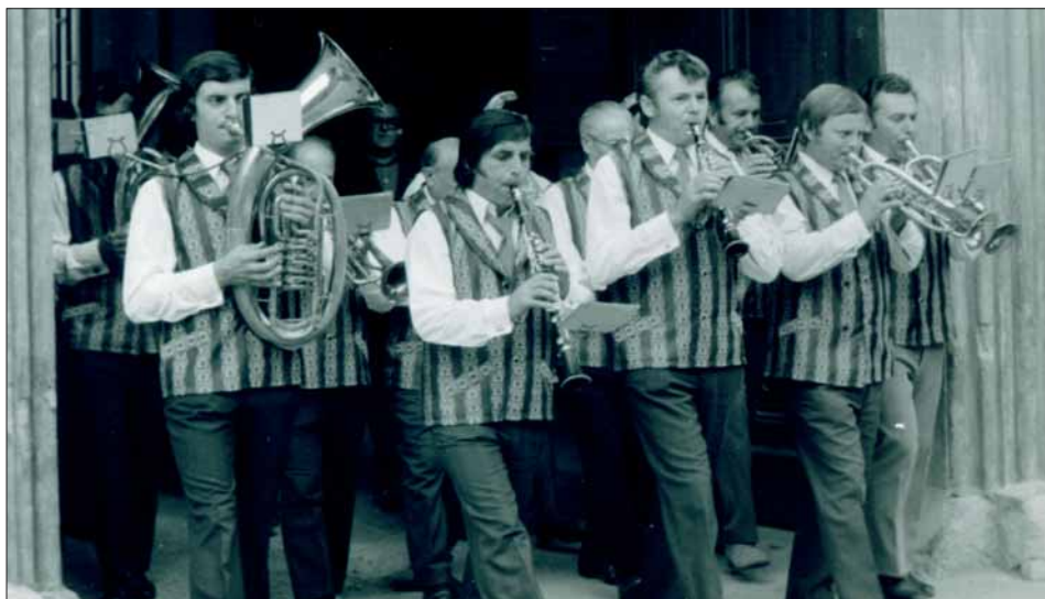
Dechová kapela kolem roku 1980