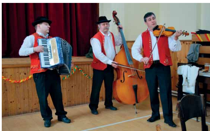
Lidová hudba Donava