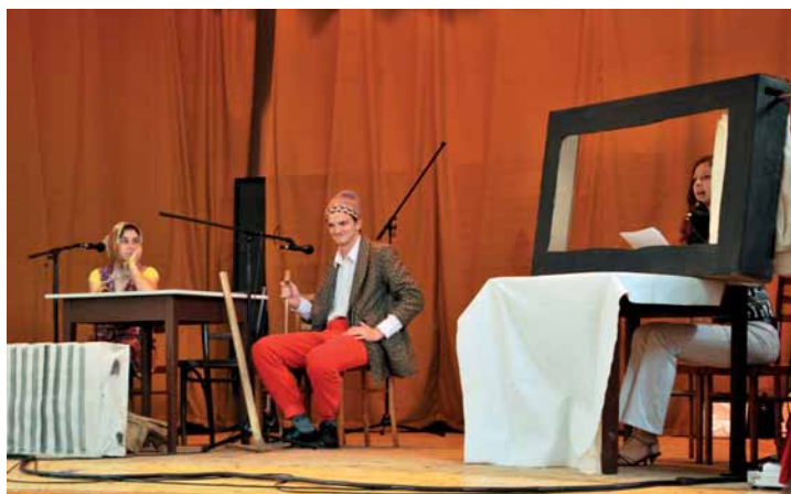
Představení sokolnických divadelníků