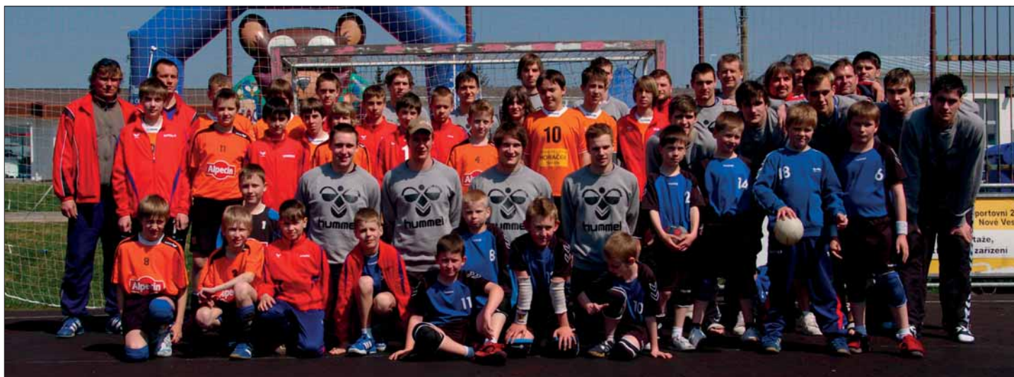
Naši mladí házenkáři s juniorským týmem ČR v Novém Veselí

turnaje vyhráli několik zápasů v řadě a hořkost porážky poznali až v závěrečném utkání o 5.–6.místo. Do konce sezony pak kluci budou hrát již tradičně na MEGASAM v Olomouci a neoficiálním mistrovství ČR minižáků v Liberci. Mimo to je čeká závěr dlouhodobé soutěže jak v dresu Sokola Telnice, tak i závěrečné kolo školní ligy v Telnici.