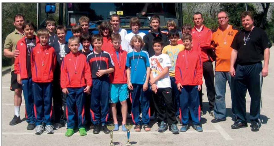
Naše výprava na turnaji v Chorvatsku