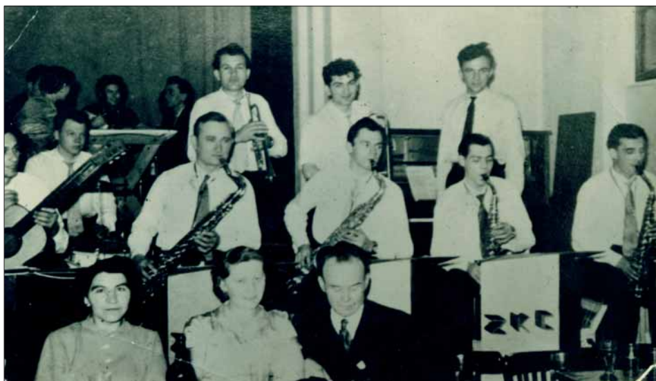
Taneční kapela v polovině 60. let