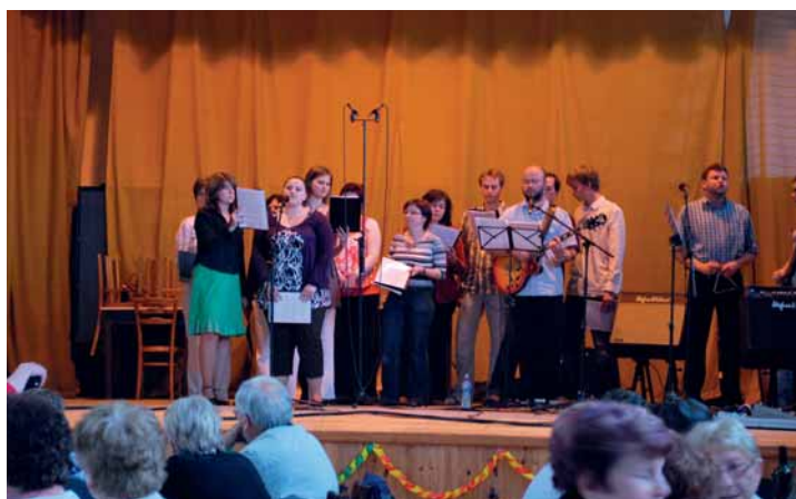
Vystoupení telnické scholy