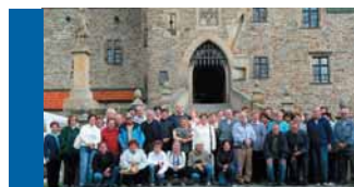
Když senioři „zájezdují“