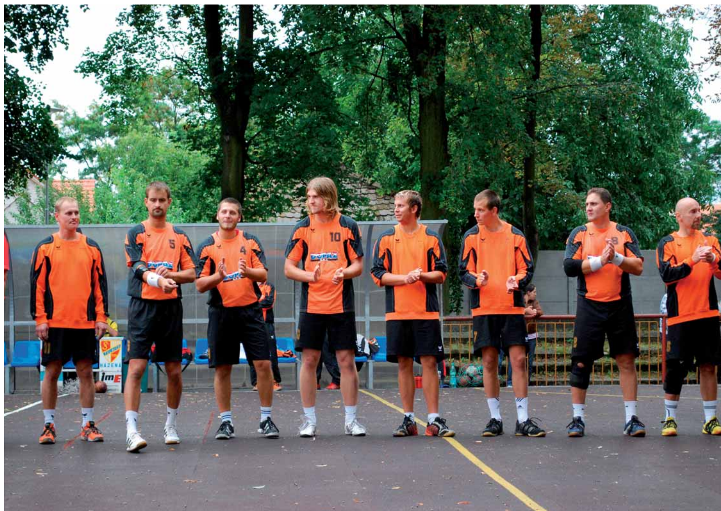
V rámci oslav 100. výročí založení Sokola v Telnici proběhl Den házené – více naleznete v článku na straně 14