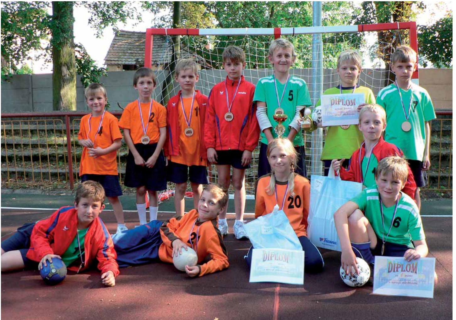
120 let existence telnické školy si naši žáci připomněli sportovním dnem, jehož průběh přibližuje článek na straně 8