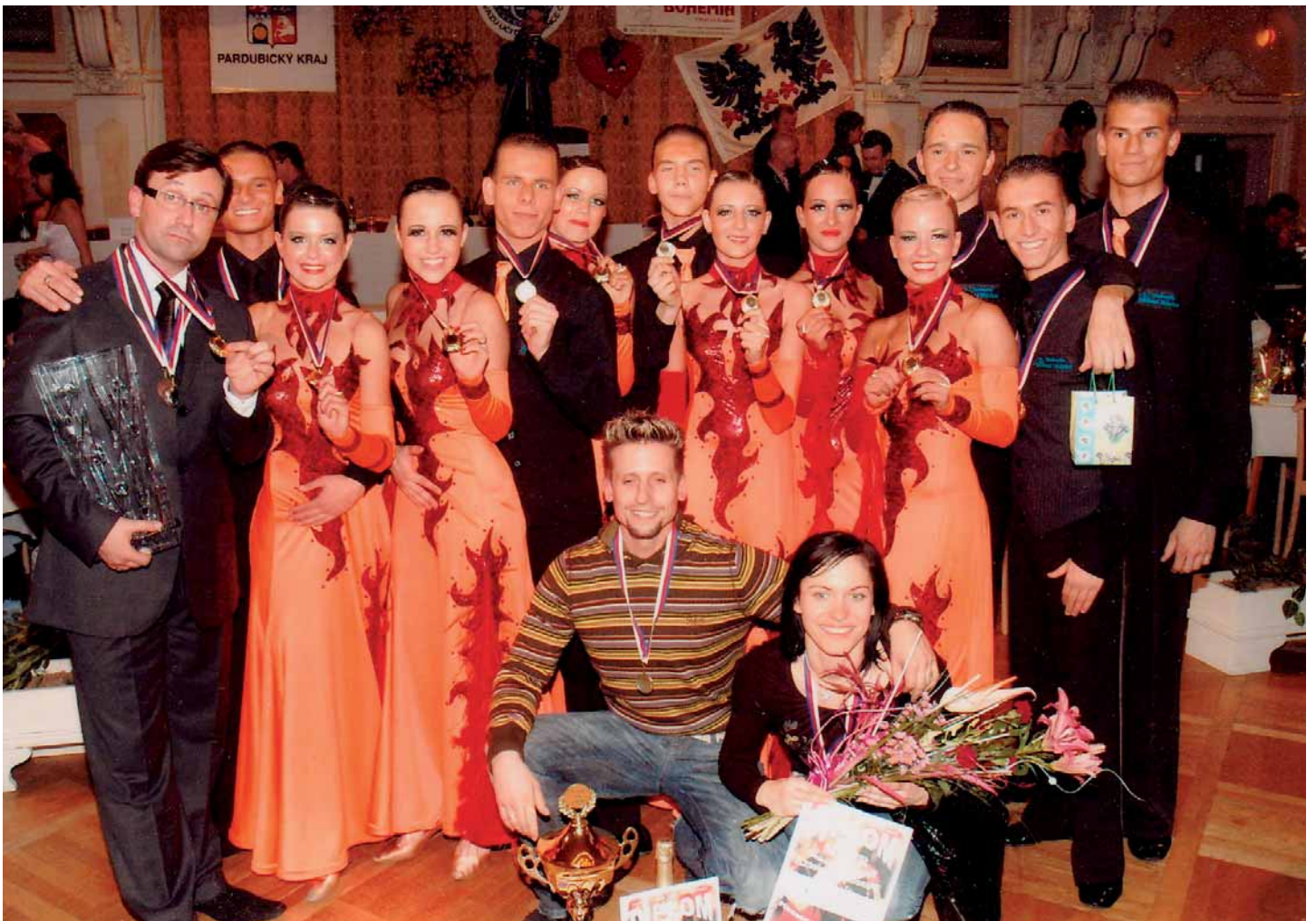
Ohlédnutí za úspěšnou první dekádu Tanečního klubu Orel Telnice naleznete na straně 14