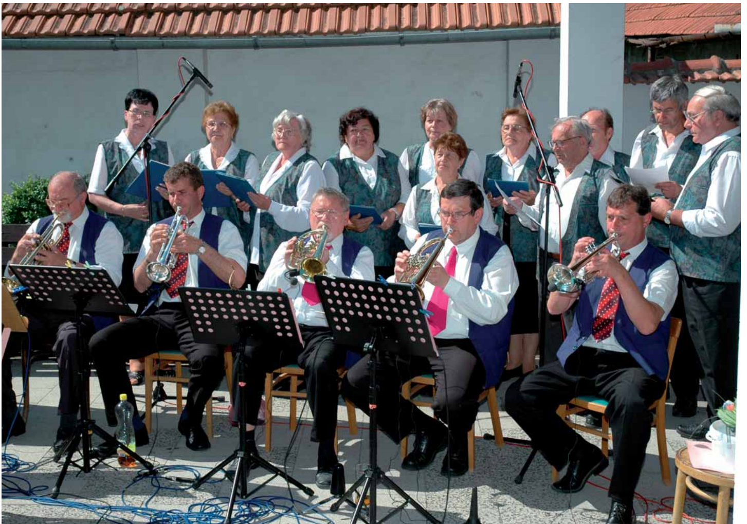
Oslavu 65. výročí dechové kapely Jana Přerovského připomíná článek na straně 6