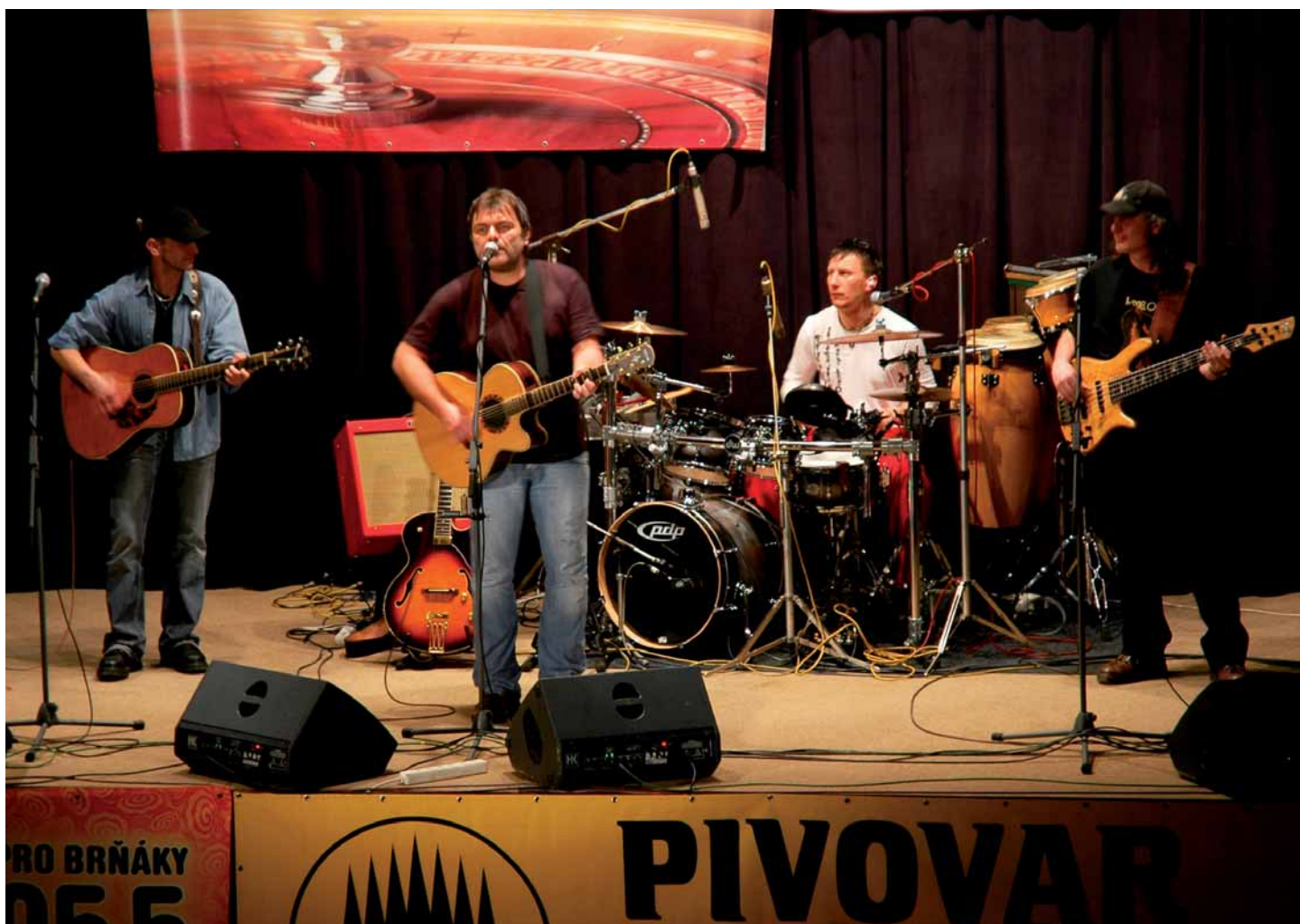
Koncert skupiny Kamelot v telnické Orlovně – viz článek na str. 10