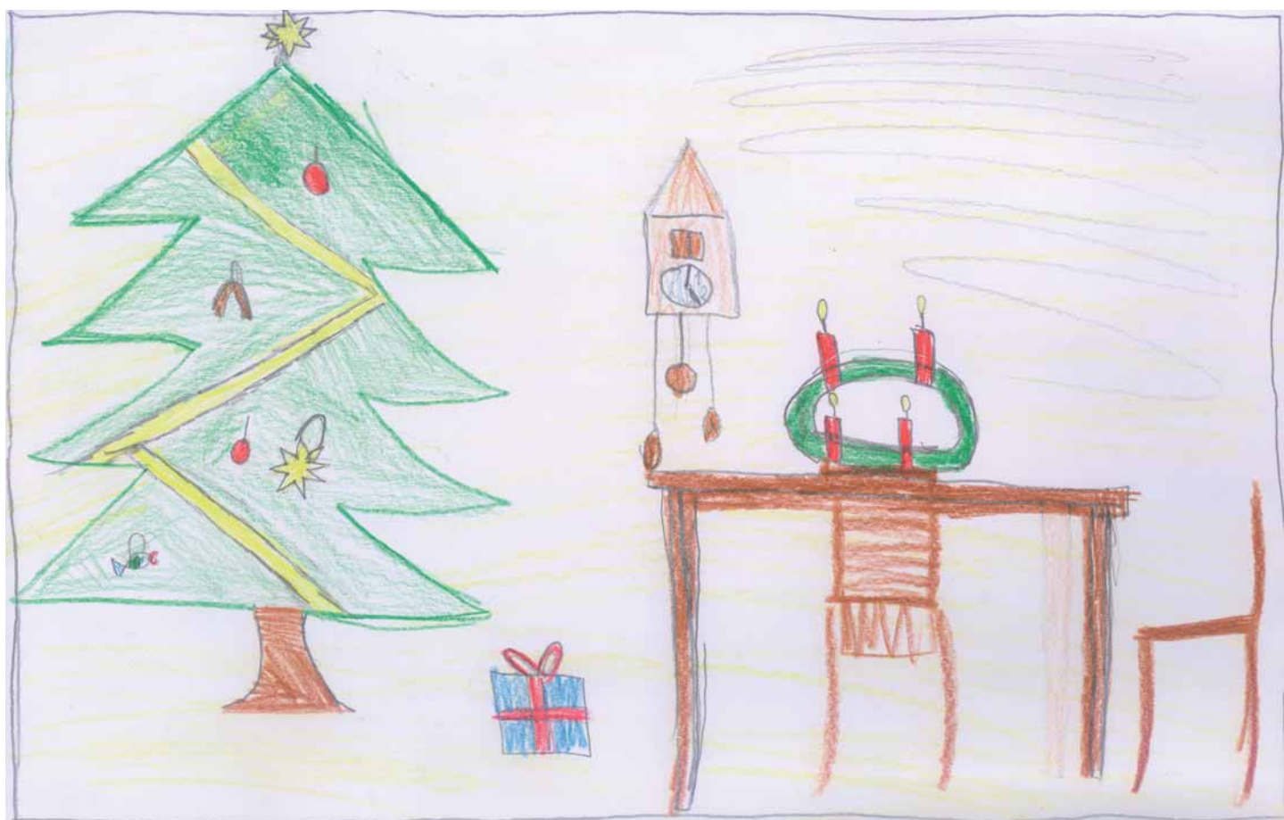
Barbora Filáková, 1. ročník