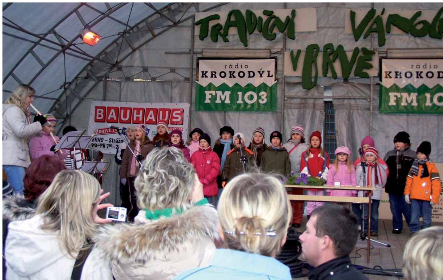
Vystoupení žáků ZŠ Telnice na vánočních trzích v Brně