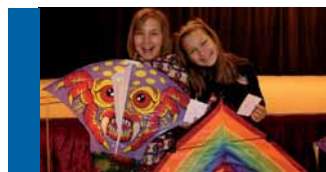
Drakiáda na Orlovně