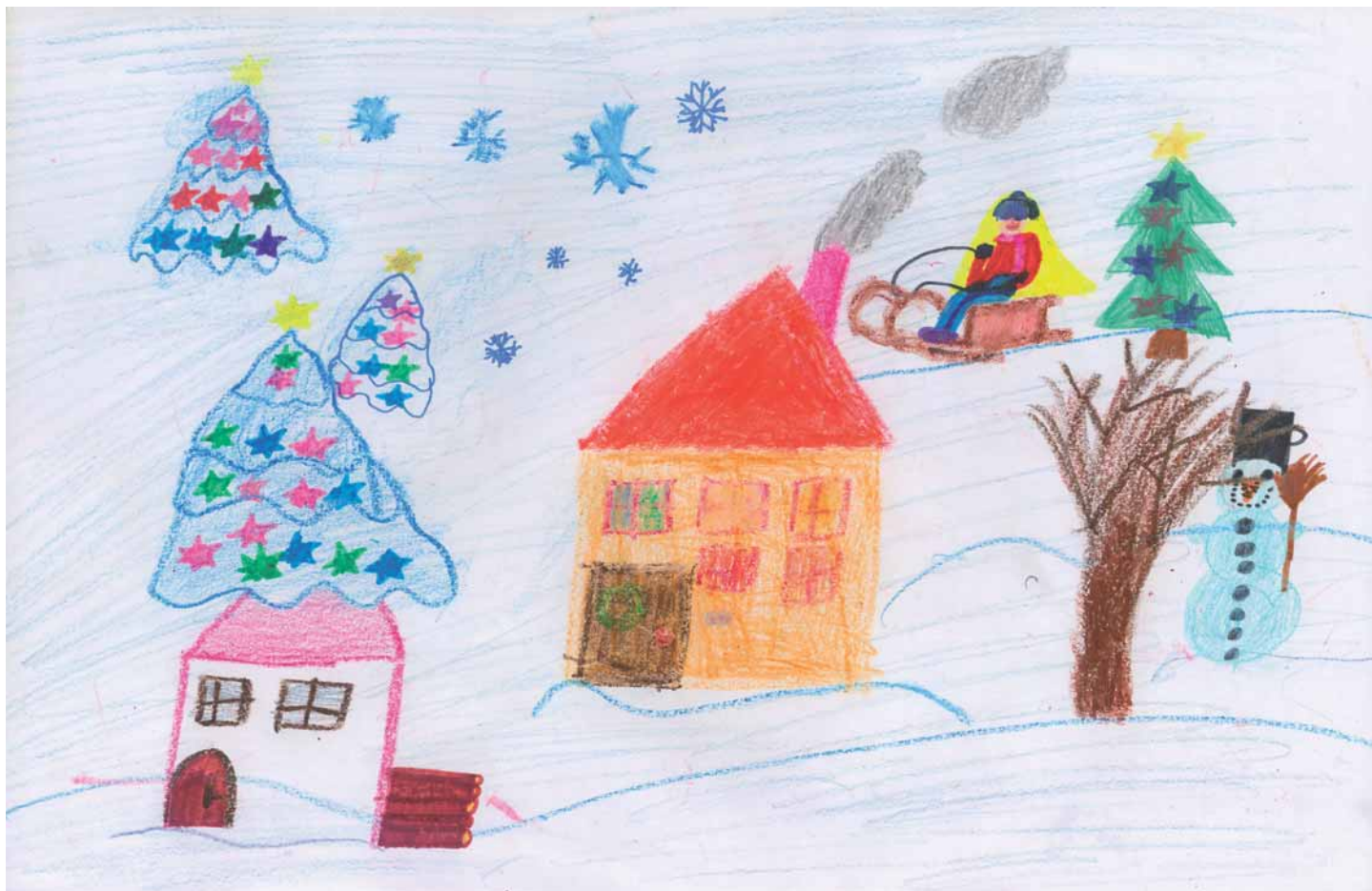
Nikola Floriánová, 4. ročník