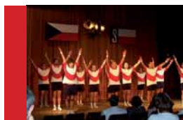
Sokolské oslavy vzniku ČSR