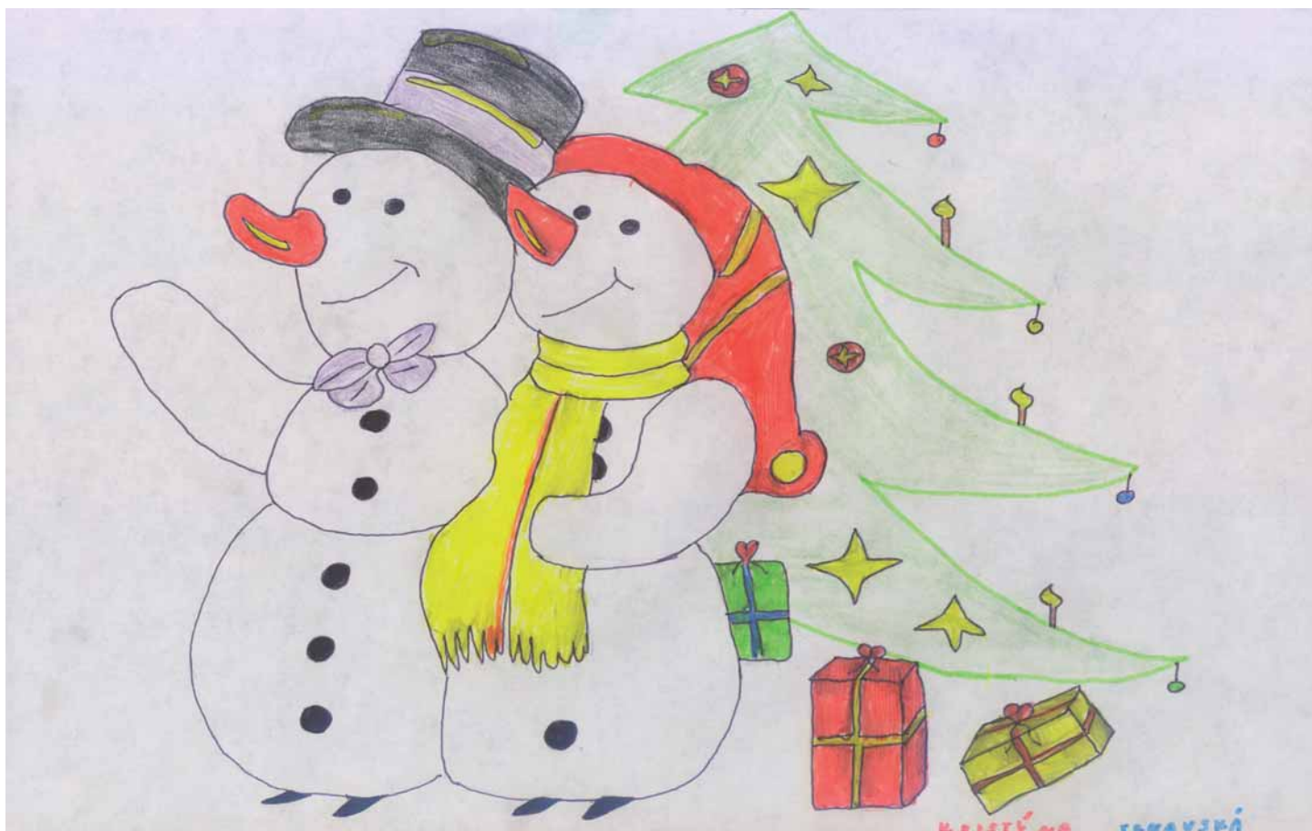
Kristýna Trnavská, 2. ročník