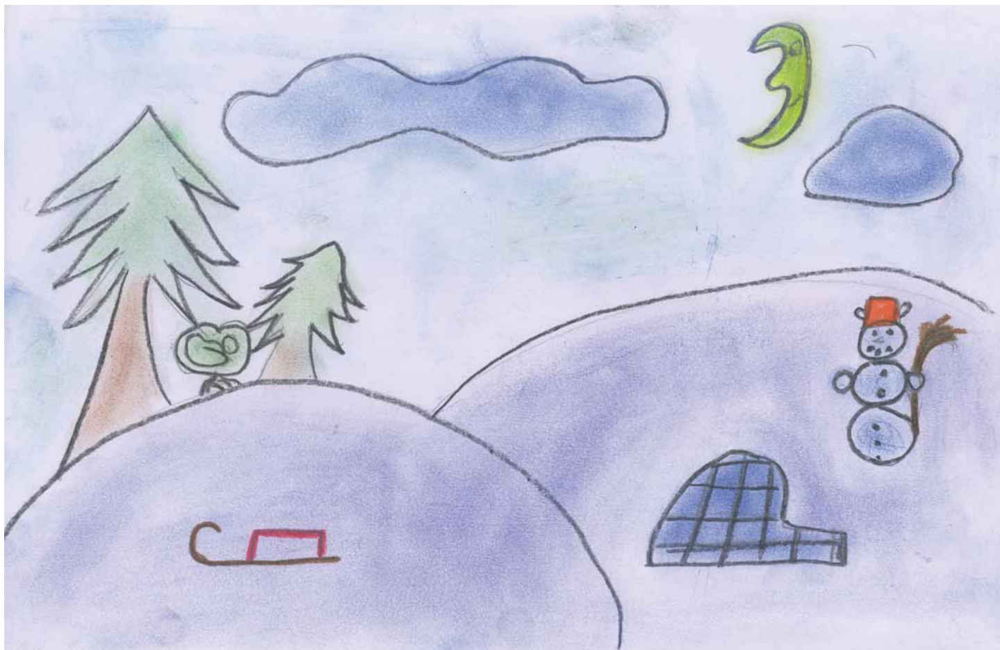
Petra Chudáčková, 3. ročník