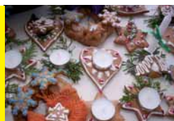
Adventní pohlázení ve škole