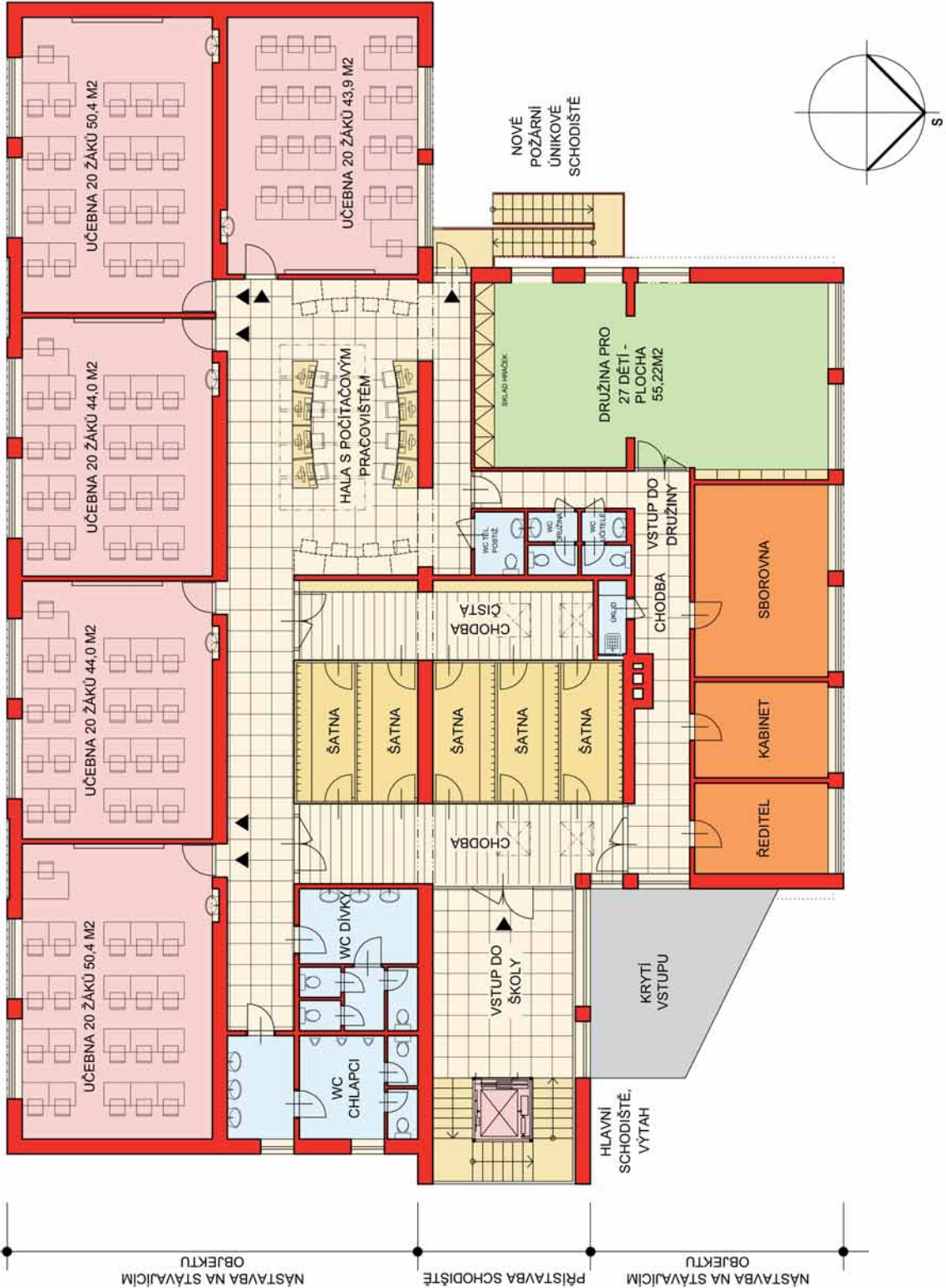
PŮDORYS 2.NP (NÁSTAVBA)

NÁSTAVBA NA STÁVAJÍCÍM OBJEKTU PŘÍSTAVBA SCHODIŠTĚ NÁSTAVBA NA STÁVAJÍCÍM OBJEKTU