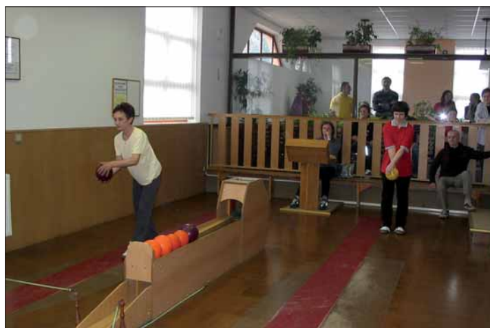
Turnaj smíšených dvojic