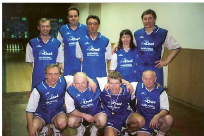
Družstvo telnických kuželkářů