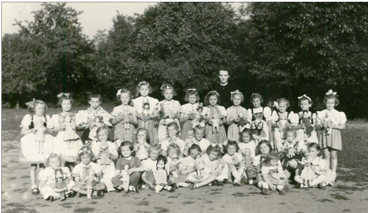
Den matek na sokolovně v roce 1941