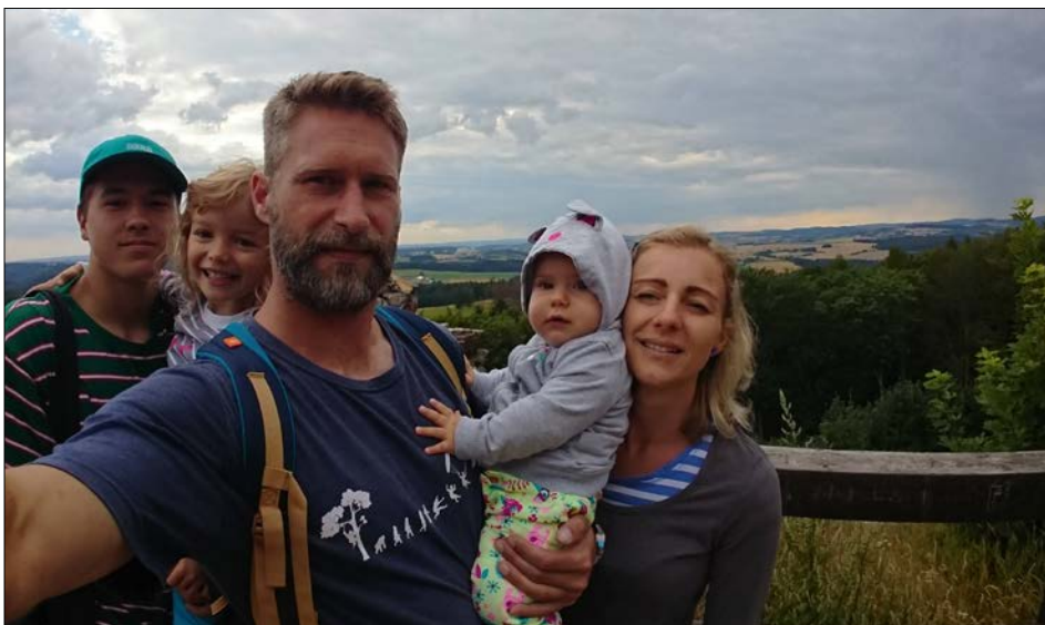
S rodinou v přírodě

Velmi pozitivně. Trenéři a vůbec všichni, kteří nám v Telnici s házenou pomáhají, odvádějí velký kus práce. Bývá zvykem, že pro většinu sportovních klubů je výkladní skříň tým mužů, u nás to však jsou naše děti a mládež, kteří telnickou házenou stále více dostávají do povědomí sportovní veřejnosti. Účastní se pravidelně prestižních turnajů a soutěží, ze kterých vozí krásná umístění. Co nás ale brzdí v rozletu, a to nejen házenou, je dnes už hraniční zázemí pro tolik mladých sportovců a aktivit, které v Sokole vytváříme. Posud' sám, jenom v házené dnes pracujeme se stovkou dětí, přičti k tomu více než dvacet mladých futsalistů, chodí k nám trénovat