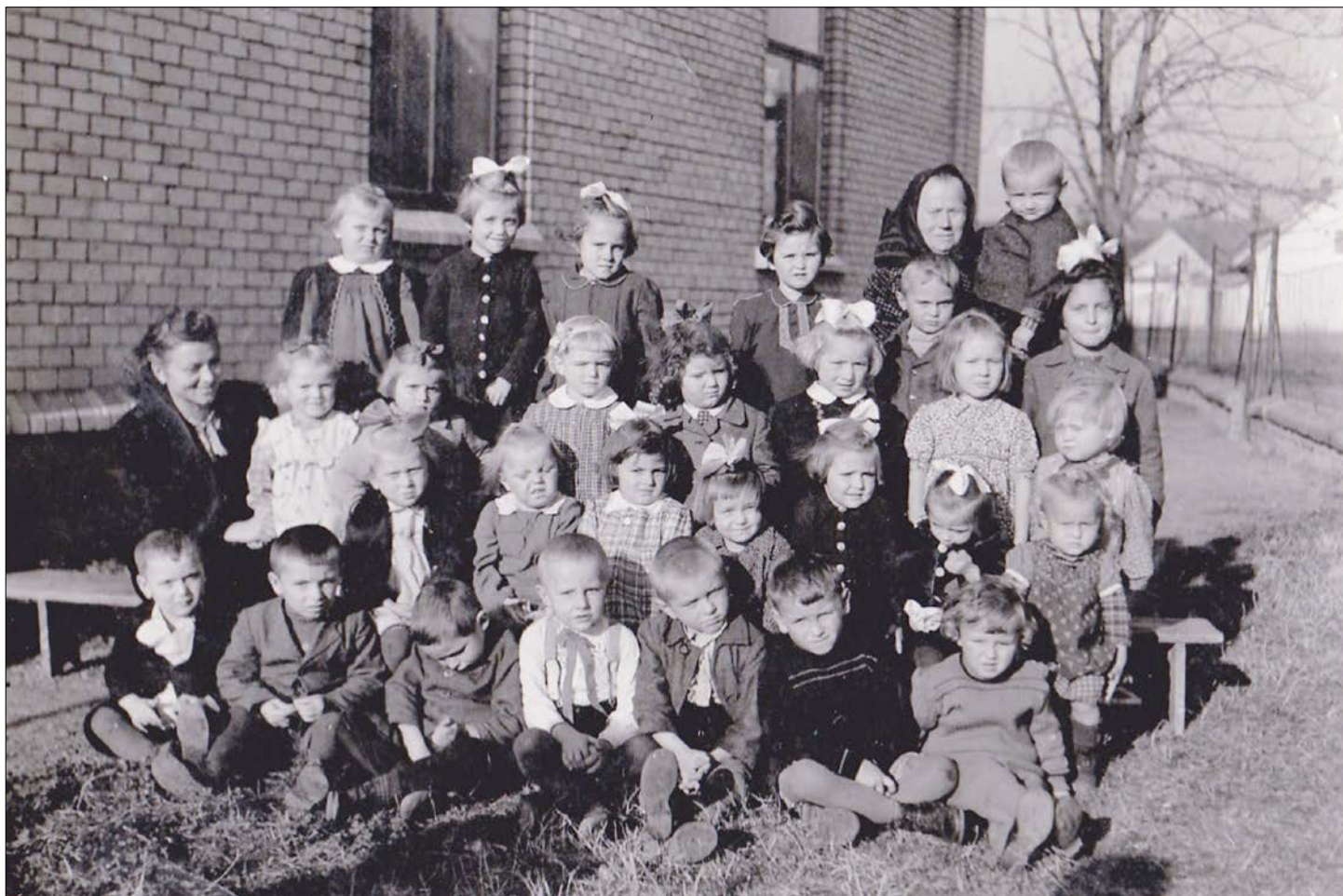
První zemědělský útulek na Moravě – školka u rybníka v říjnu 1945

podél potoků, kol mlýna k Sokolnicím, do lesíku a po krátké přestřelce ustoupili za železniční trať. Toho dne bombardovali Němci dělostřelecky Telnici a zasáhli krám Dvorského č. 12 a škola dostala dva zásahy. Prozatímní most přes potok byl po poledni hotov. Pak zde projíždělo mnoho vojska motorizovaného, i s koňskými potahy s různými spřeženími a vozy tak, jak byly nasbírány cestou bojů. Tak bylo vidět koně malé s pantovými postroji, uherské koně s dlouhými těžko kovanými vozy, s rakouskými silnými ‚Oldenburáky‘ s vysokými kovanými chomouty zapřaženými ve fasměky, i moravské vozy s hbitými slováckými koňmi. Na vozech bylo vidět bečky vína z jižní Moravy. Vojskáci byli v náladě, usmívali se a zdravili.“