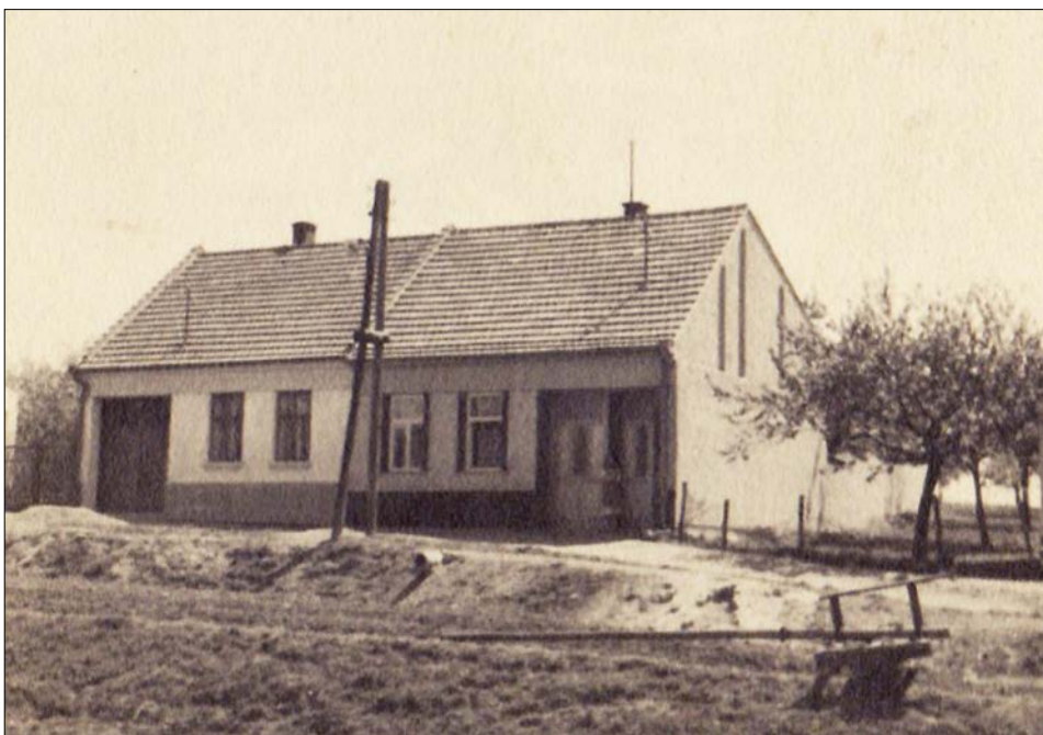
Ulice Vinohrádek (dnes Palackého) v květnu 1943