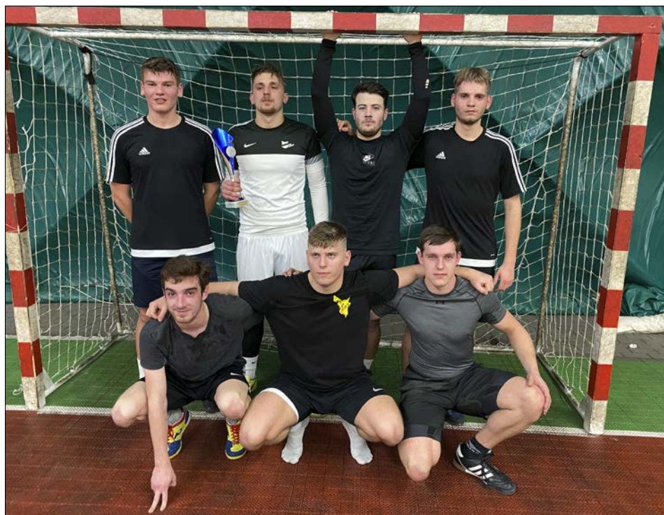
Vítězný tým Měšina po finálovém zápase

rovou“ (stačila by remíza). I tak je třeba naše reprezentanty pochválit za bojovnost a v letošním roce i poměrně vysoký