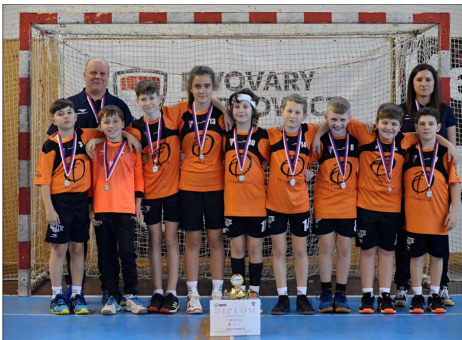
Stříbrný starší tým

Mladší kluci přípravy na skupiny dělení nebyli. Vzhledem k nižšímu počtu zúčastněných družstev hráli systémem každý s každým. A s každým si celkem hravě poradili. Turnaj jim perfektně sednul a v každém utkání se vybičovali k takovému výkonu, že jim nikdo nedokázal konkurovat. Dařilo se dobře bránit a ještě lépe spolupracovat v útoku. Výsled-