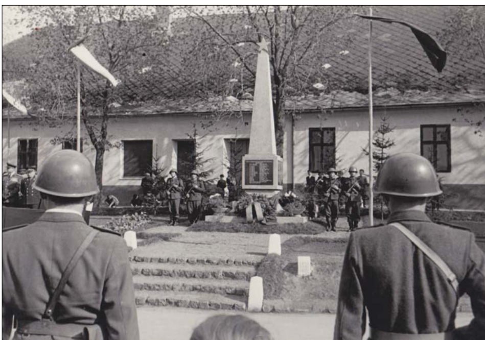
Slavnostní odhalení pomníku obětí II. světové války dne 21. dubna 1957

a v díře ležel německý mundúr, tam se asi německý voják převlekl do civilu. Na Gallově poli ještě větší kuželovitá díra od bomby. Obě bomby byly určeny na skladiště munice u sokolovny. U domu č. 180 plot povelan na zem, na zahradě zůstaly dva půlkruhové zákopy a v nich spousta kulometných střel, ruč-