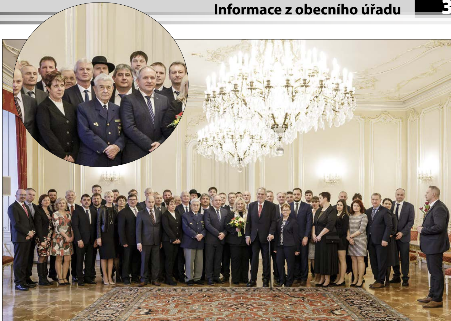
Na audienci u prezidenta Zemana (telnický starosta v klobouku)

starosty přijal a vyslechl si od každého z nich krátké představení jeho vesnice. Jelikož nakonec jako jediný cestoval starosta do Prahy v (ženáčském) kroji, pozdravil prezidenta originálním ves-