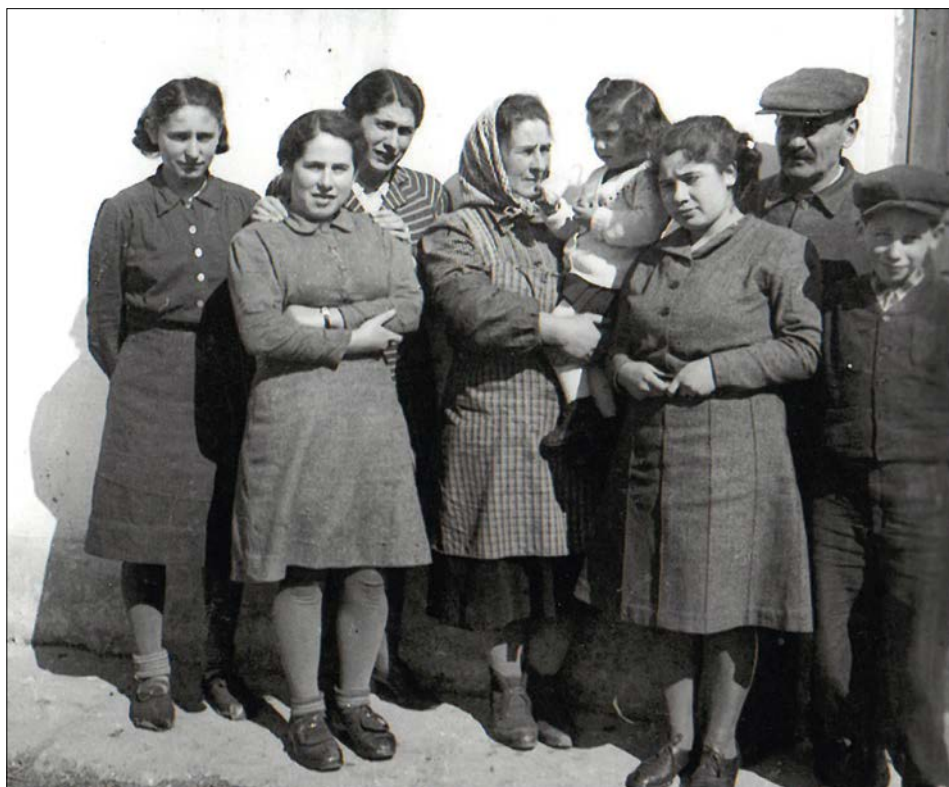
Židovská rodina Moravcových v době II. světové války před nuceným odjezdem do koncentračního tábora

dlochovic, odkud příchod osvoboditelů neočekávali, teprve později se dověděli, že RA neútočí ze směru, kde je očekávala německá armáda, ale obchází jejich vybudované opevněné pozice.