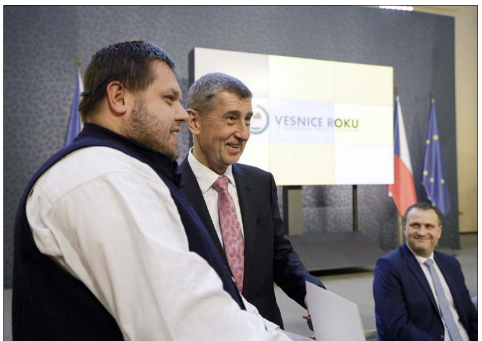
Na Úřadě vlády s premiérem Babišem

Nedlouho na to se početná delegace starostů vydala také na Pražský hrad, kde byla přijata současnou hlavou státu, panem Milošem Zemanem. V krásných hradních prostorách prezident