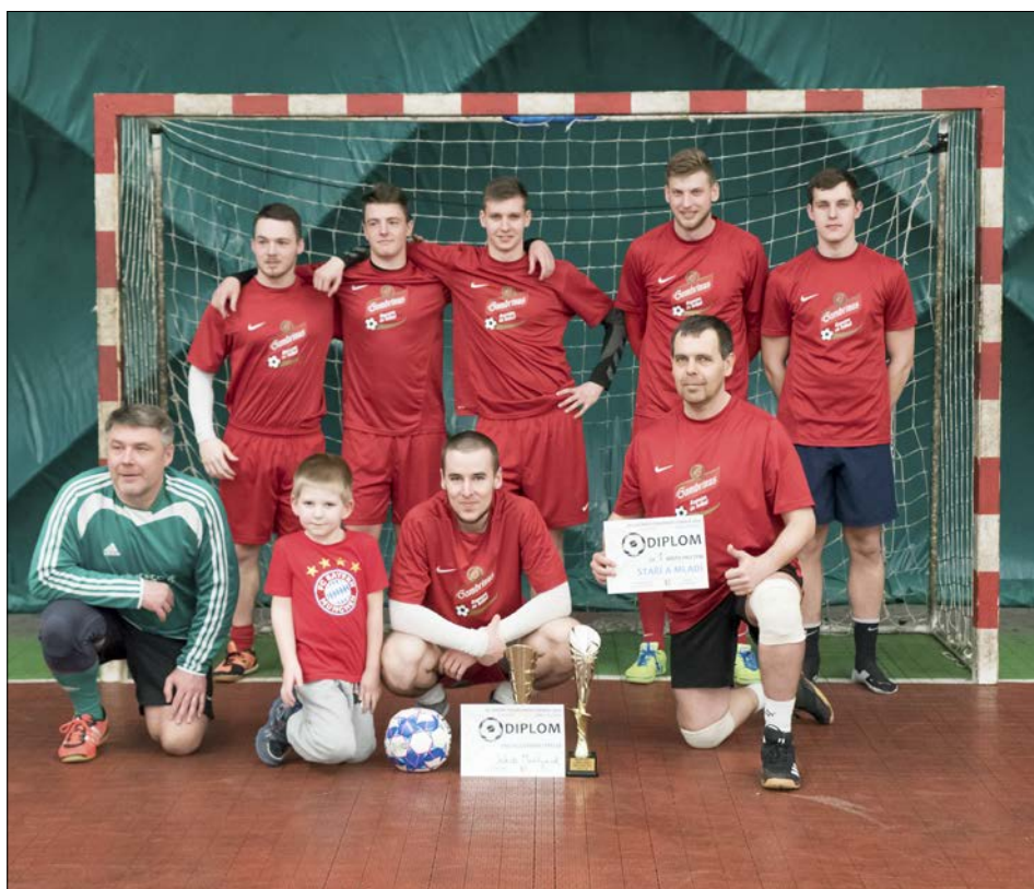
Vítězný tým Staří a mladí