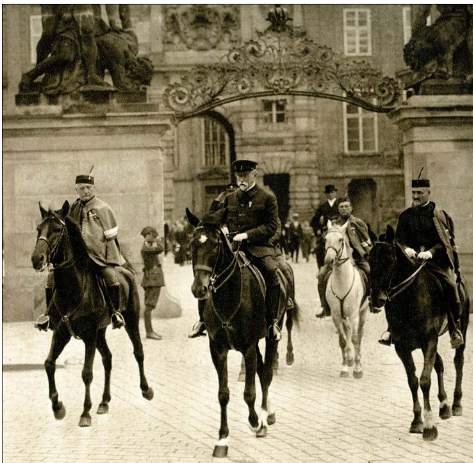
Sokolové doprovázejí TGM na cestě z Pražského hradu na nově otevřený strahovský stadion, kde shlédl VIII. všesokolský slet (1926)

TGM byl také velkým sokolem. Sokolský život mohl sledovat v Praze již od roku 1882, kdy se stává profeso-