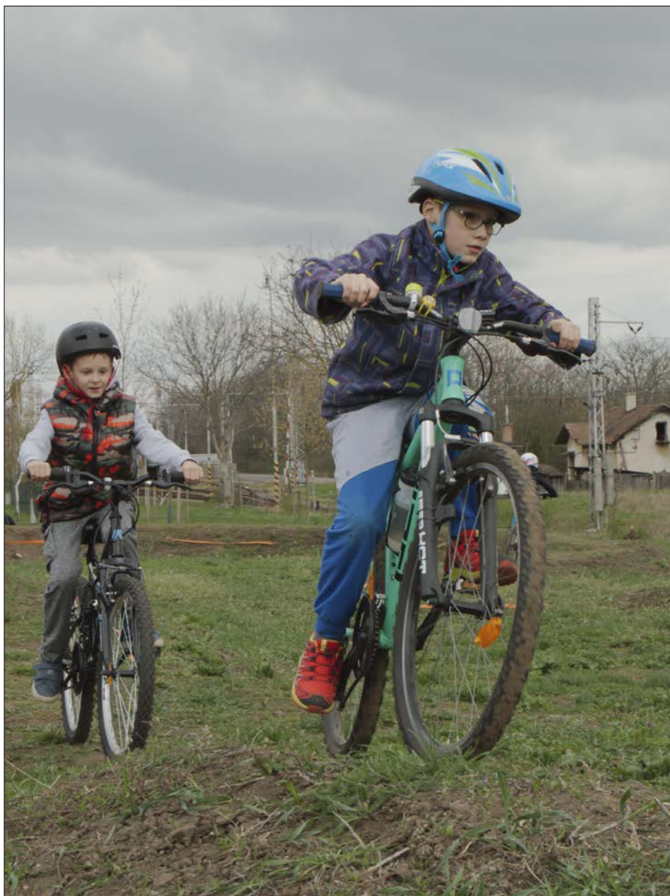
Díky auditu vznikla mj. terénní cyklodráha v parku v nádražní čtvrti

ření, která byla v Telnici díky auditu zachována (tzn., že byla již zavedena před auditem a ten pouze stvrdil jejich důležitost a význam pro život v obci). K takovým opatřením se řadí Vítání občánků, udržování a obnova dětských hřišť, zachování dotačních programů, podpora seniorského klubu