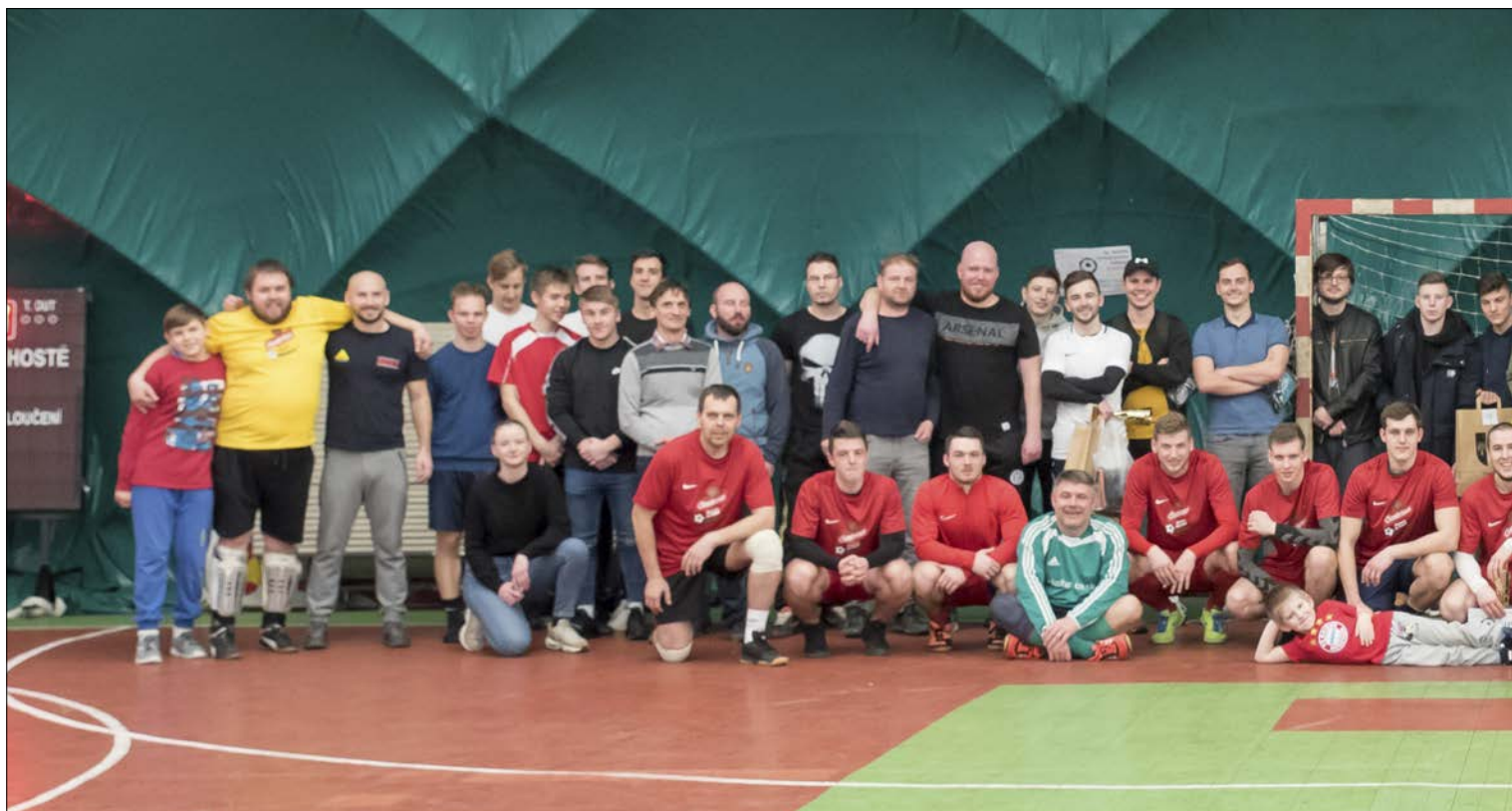
Společná fotografie dvanácti zúčastněných týmů

přístupem přispěli k úspěšnému vyvrcholení našeho turnaje. Díky také všem rozhodčím a pořadatelům, zvláště pak restauraci U Seňora za všechny kulinářské speciality.