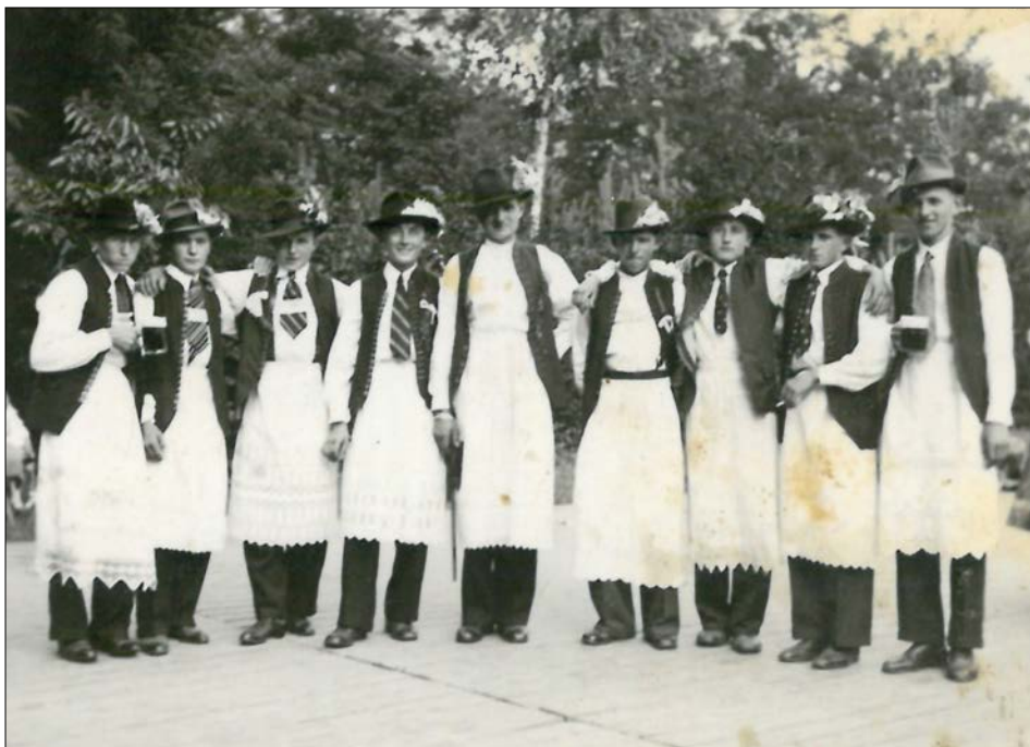
„Krojování“ telníční chlapi na orlovně těsně po válce

Ze školní kroniky: „Němci kvapem opustili naši vesnici o ½ 6. hodině a do školy přišli první Rusové v 6 hodin. Tou dobou měli již obsazeny Draha, silnici k Žatčanům, Nádražní ulici, střed dědiny. Němci od Měnína ustupovali jen