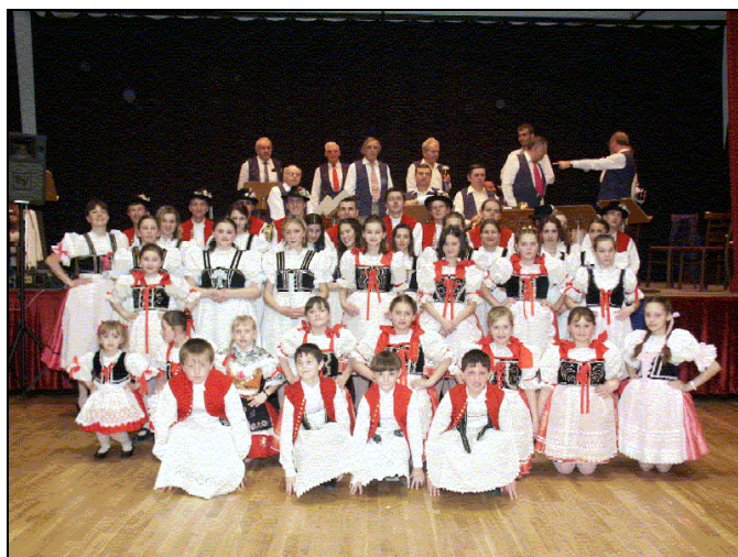
Sbor dobrovolných hasičů a Orel jednota Telnice

Tělovýchovná jednota Telnice „Sport pro všechny“, uspořádala 8. 3. v prostorách orlovně turnaj v kuželnkách. Turnaje se zúčastnilo 9 místních společenských organizací. Čtyřčlenná družstva na 160 hodů soutěžila o co nejlepší umístění. Průběh turnaje měl přátelskou atmosféru, kdy účastníci bouřlivě fandili i svým soupeřům za každý dobrý hod. Vítězem turnaje se stalo družstvo Orla Telnice se 796 kolků.