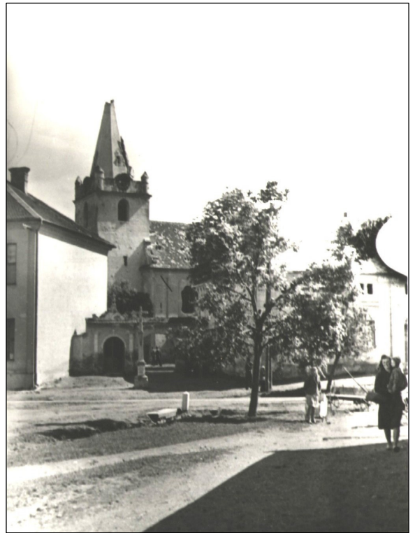
Tak vypadala věž našeho kostela 24. 4. 1945