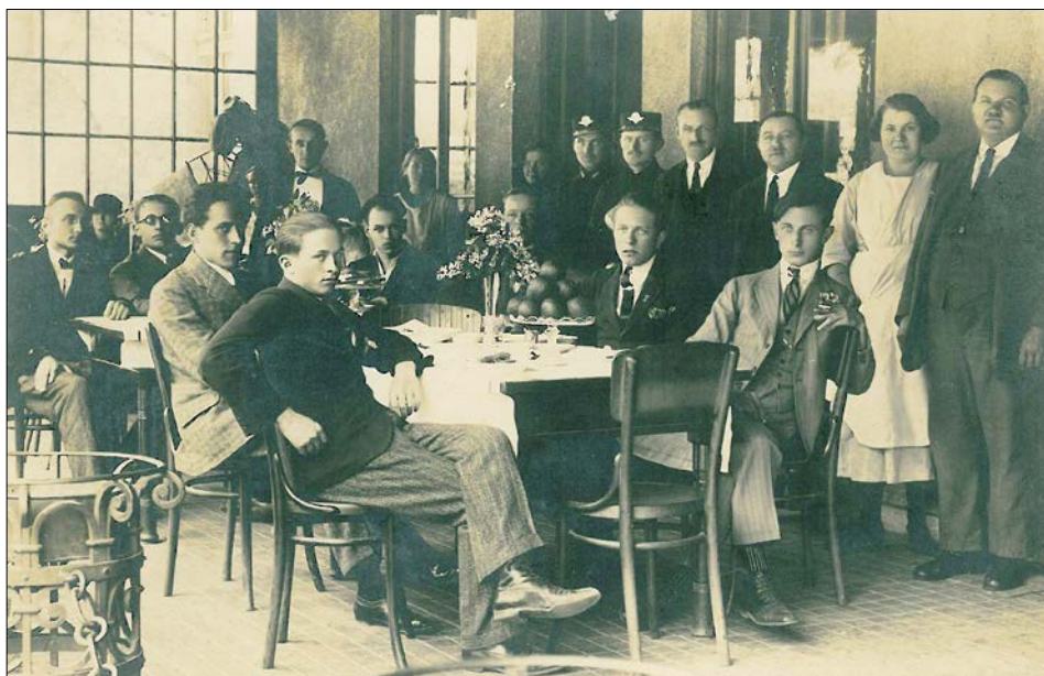
Fotografie z hospody v Kežmaroku

západ ve střední části tzv. východní fronty. Po 133 dní trvajícím obléhání pevnosti Přemyšl se do ruských rukou vzdalo téměř 120 000 vojáků vyhladovělé a zoufalé posádky. Obléhání Přemyšle tehdy sledoval s napětím celý svět. Zajetí asi 120 000 rakousko-uherských vojáků včetně devíti generálů využili Rusové dovedně k povzbuzení nálady vlastního vojska v poli i veřejnosti v zázemí. Zajatce čekalo defilé moskevskými ulicemi (viz fotografie).