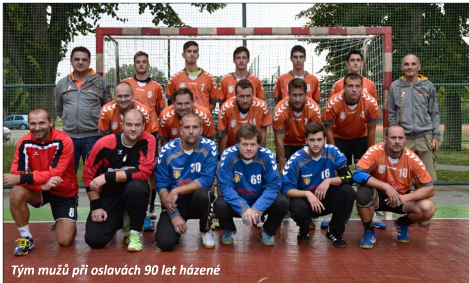
Tým mužů při oslavách 90 let házené