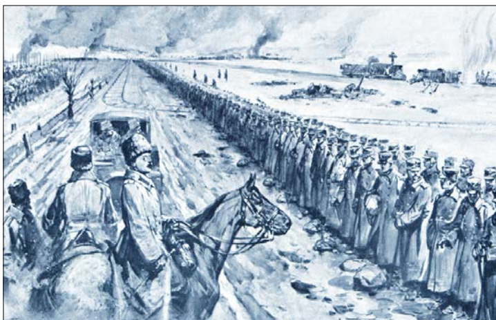
Kapitulace pevnosti Přemyšl od Seppings-Wrighta. Do nedohledna se táhnoucí řady rakousko-uherských válečných zajatců nastoupené k přehlídce. Na pozadí v dálce stoupá kouř z hořících fortů.