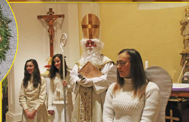
Setkání se svatým Mikulášem v kostele