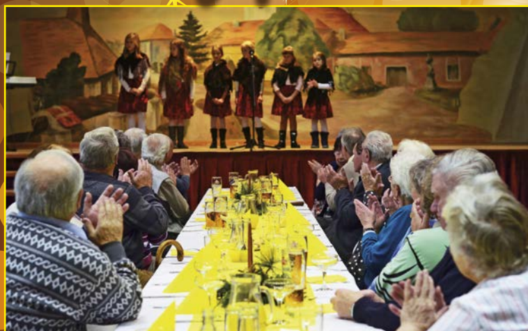
Vánoční setkání se seniory