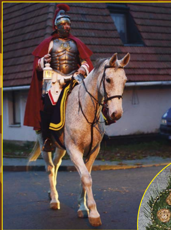
Přípomínka svátku sv. Martina