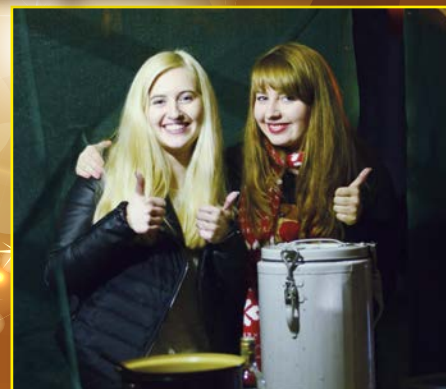
Vánoční minitrhy T-Parlamentu