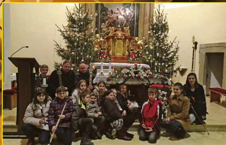
Zpívání koled u betléma