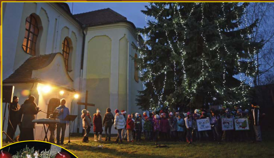
Rozsvěcení vánočního stromu