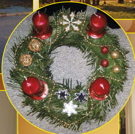
Tvoření adventních věnců