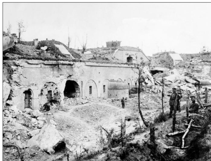
Pevnost Přemyšl poškozená dlouhými boji