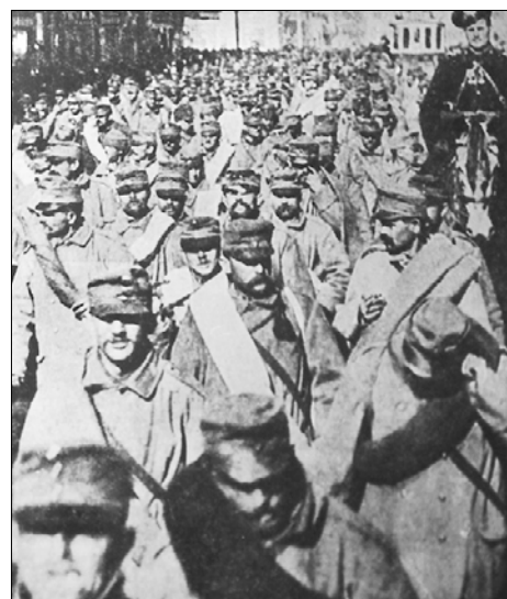
Defilé zajatců v Moskvě