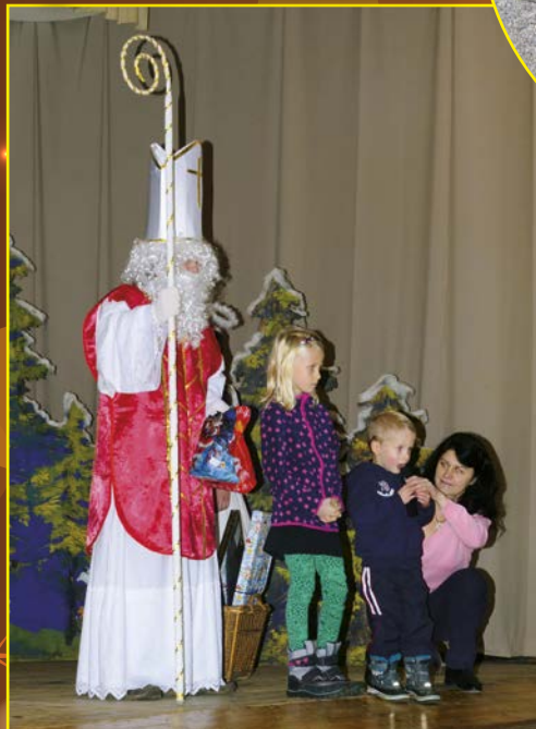
Mikulášská nadílka na sokolovně