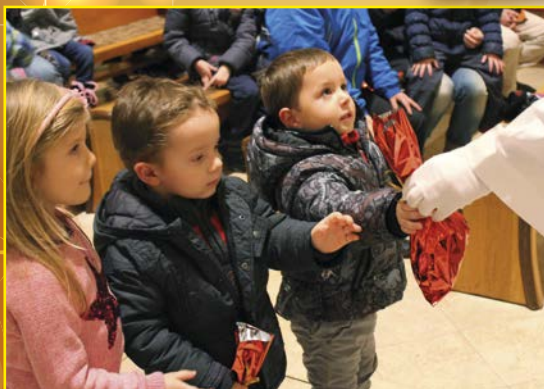
Dárky od svatého Mikuláše